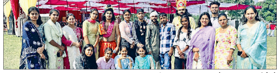
कैथल