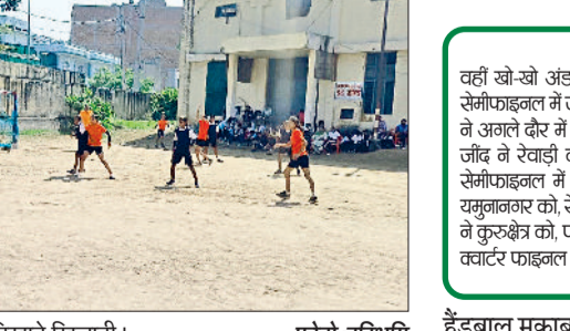
जींद। प्रतियोगिता में दमखम दिखाते खिलाड़ी।