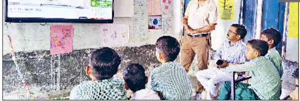
जींद। कार्यक्रम देखते हुए बच्चे।

शिक्षा विभाग द्वारा सभी विद्यालयों में कक्षा छठी से बारहवी के बच्चों को विकसित भारत बिल्डकॉन कार्यक्रम जो सुबह 10 बजे से 12 बजे तक राष्ट्रीय स्तर पर दिखाया गया। जिसमें राजकीय माध्यमिक विद्यालय बरसाना के बच्चों ने अपने अध्यापकों की देखरेख में उत्तुकता पूर्वक देखा।