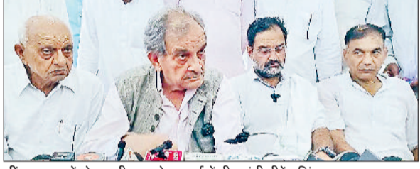
जींद। पत्रकारों से बातचीत करते हुए पूर्व केंद्रीय मंत्री बीरेंद्र सिंह।