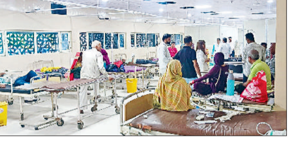
जींद। नागरिक अस्पताल में शुरू हुआ एमरजेंसी वार्ड।