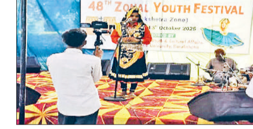
कैथल। सांस्कृतिक प्रोग्राम में अपनी प्रस्तुति देती छात्राएं।